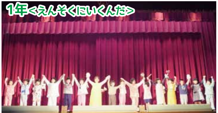
初めての学芸会、みんなの笑顔がステキでした。