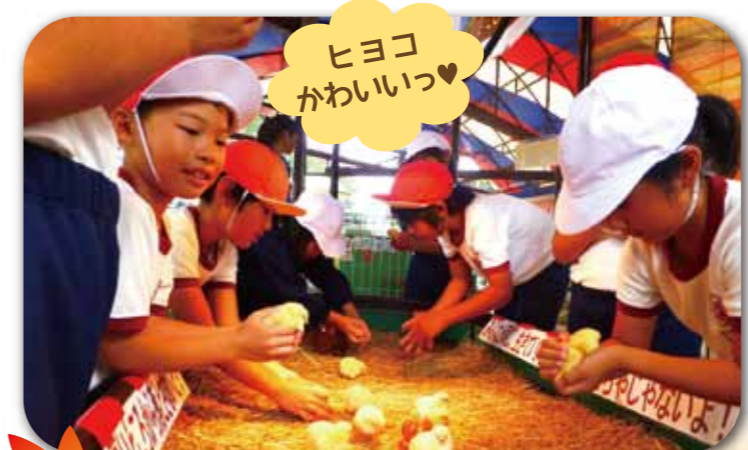
1・2年生 福山市立動物園 富谷ドームランド