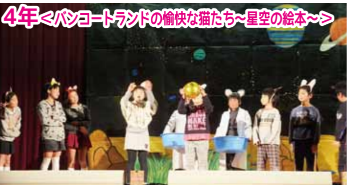
みんなの声がひびき、迫力のある演技でした。