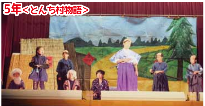
さすが5年生! チームワーク抜群でした。