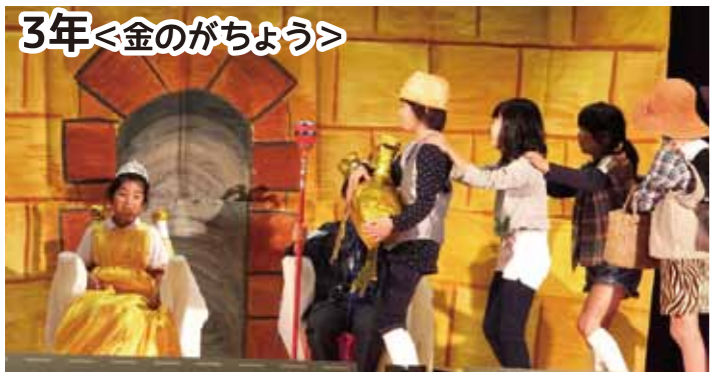
みんなが協力した、素晴らしい劇でした。