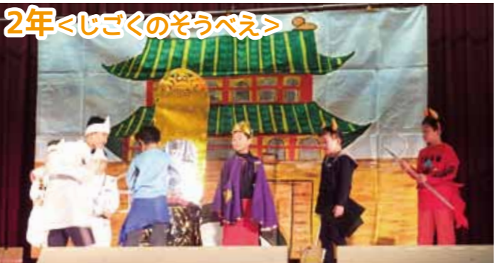
工夫を凝らした衣装と演技で楽しめました。