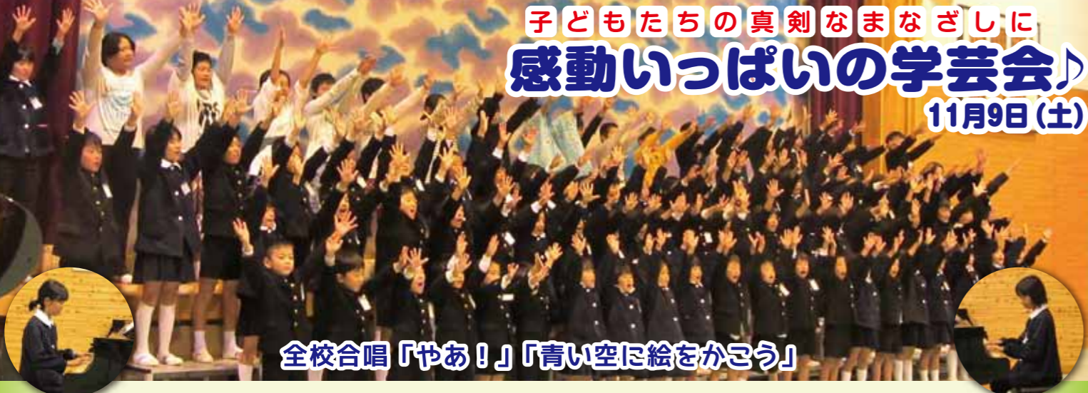
全校合唱「やあ!」「青い空に絵をかこう」