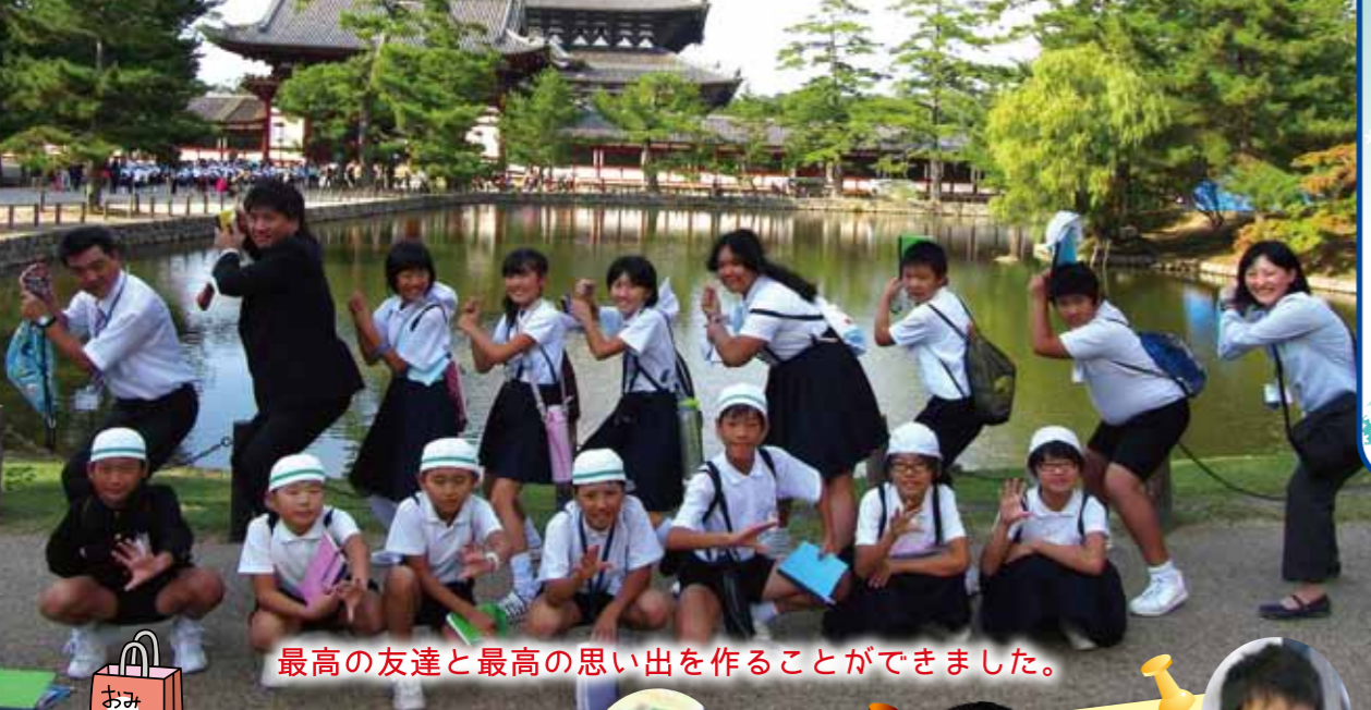
最高の友達と最高の思い出を作ることができました。