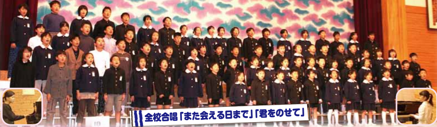
|| 全校合唱「また会える日まで」「君をのせて」