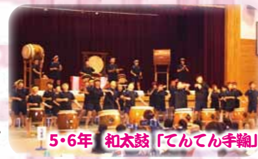
5・6年 和太鼓「てんてん手鞠」

今年の学芸会は,日本や外国の昔話や有名な小説,時代劇や現代劇や戦争についての話など,とてもバラエティ豊かでした。和太鼓演奏,全校合唱,開会や閉会のことばと係の活動などに,小田っ子80人が全力を出しきった素晴らしい学芸会でした。いつもお世話になっている地域や保護者の皆様に見ていただくことができ,本当に良かったと思います。ありがとうございました。